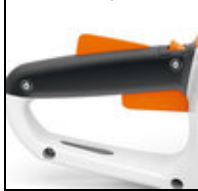
Softgriff mit Schalthebel

Der Akku kann in 2 Stufen in das Gerät eingeschoben werden. In der ersten Raststufe, der Zwischenposition, ist der Akku fest im Gerät fixiert, berührt aber nicht die Kontakte im Gerät. In der zweiten Raststufe, der Betriebsposition, ist der Akku komplett eingeschoben und berührt die Kontakte im Gerät.