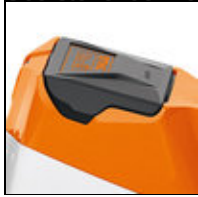
Zwischenposition für Akku im Gerät

Überstehende Tropfen halten den Ast während des Schnitts am Messer. Die Schnittleistung wird so deutlich gesteigert.